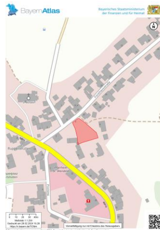
Lageplan Fl.Nr. 83/1