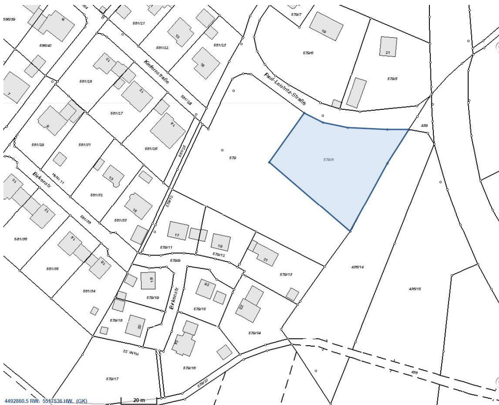
Lageplan mit blau markierter Verkaufsfläche (Bayerische Vermessungsverwaltung)